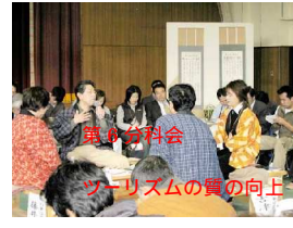
観光分科会 ツーリズムの質の向上