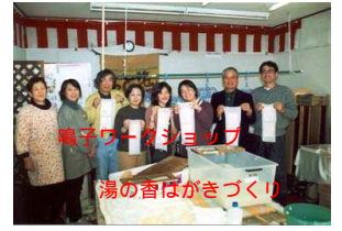
鳴子ワークショップ 湯の香ばがきづくり

足と同時に動き出したビッグイベント「第2回 全国グリーン・ツーリズムネットワークみやぎ鳴子大会」が1月21・22日に無事終了し、あっという間に新しい年を迎えたという感じです。全国から600名を超える参加者が集い、7つの各分科会では白熱した議論が展開されました。