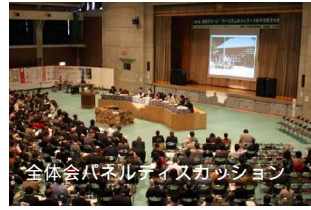
全体会パネルディスカッション